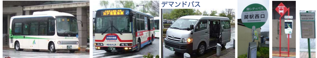
車両・バス停イメージ

ayuca ICカード「ayuca」使えます (路線 D1~D4を除く) ポイントは付与されません 「TOICA」「manaca」等 他のICカードは使えません