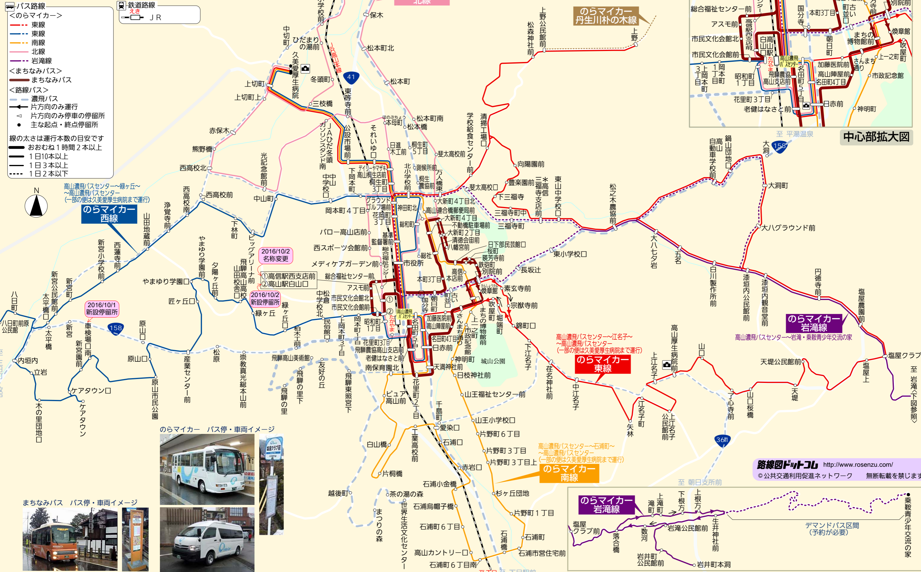
のらマイカー バス停・車両イメージ